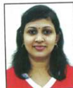
ರೂಪ ಪ್ರವೋದ್ ಮಹಿಳಾ ಸಂಚಾಲಕಿ