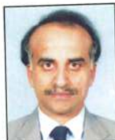
ಬಿ.ಜಿ.ವಾಲ್ ಉಪ ಸಂಪಾದಕರು