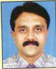
ಸುಬ್ರಮಣ್ಯ ಸಾಂಸ್ಕೃತಿಕ ಕಾರ್ಯದರ್ಶಿ