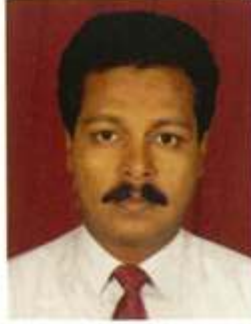
ಆರವಿಂದ ಪಾಟೀಲ್ ಉಪಾಧ್ಯಕ್ಷರು