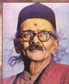
ದ. ರಾ. ಬೇಂದ್ರೆ