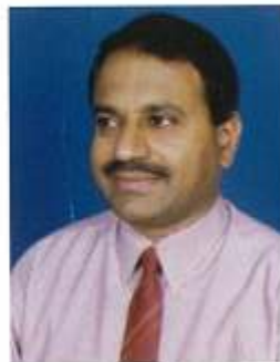
ಮಧು ಹೆಚ್.ಕೆ. ಪಿ.ಆರ್.ಓ.