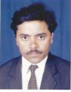
ಆಲೂರ್ ಎಸ್. ಎಸ್. ಪ್ರಗತಿ ಸಂಯೋಜಕರು