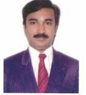
ಡಾ| ಪ್ರವೋದ್ ಸಹ ಸಂಪಾದಕರು