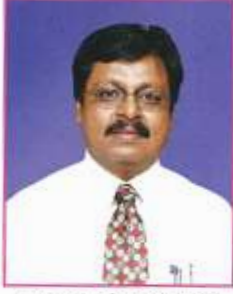
ಅರವಿಂದ ಪಾಟೀಲ್ ಅಧ್ಯಕ್ಷರು